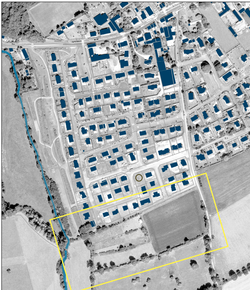
Coulée verte du coteau : accès et aménagement

Elle en reprendra les modalités d'aménagement, c'est-à-dire la création d'un quartier d'habitat ouvert sur la coulée verte qui occupe le coteau Est du Bordel, forme une large lisière plantée au sud-ouest du village et dote le quartier d'espaces verts récréatifs.