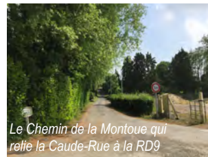
Le Chemin de la Montoue qui relie la Caude-Rue à la RD9