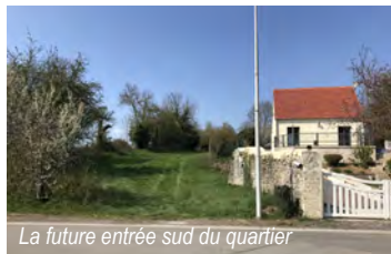
La future entrée sud du quartier