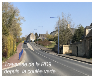
Traversée de la RD9 depuis la coulée verte

MODALITÉS D'AMÉNAGEMENT : > Aménagement d'ensemble par une seule opération