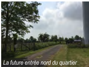
La future entrée nord du quartier